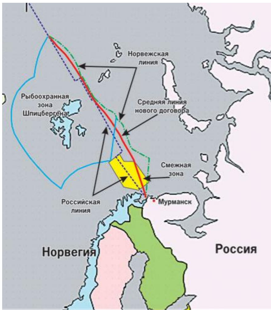
Рисунок 1. Схема раздела Баренцева моря [4] URL: http://nord-news.ru/main_topic/?mtopicid=282

Следствием различных подходов к осуществлению делимитации в Баренцевом море образовался спорный район (см. схему [4]) между российской и норвежской линией. Первая является границей полярных владений России по секторальному принципу, вторая – срединной линией, то есть равноудаленной от архипелагов Шпицберген, Земля Франца Иосифа и Новая Земля. Площадь спорного района как раз и составляет 175 тыс. км 2 .